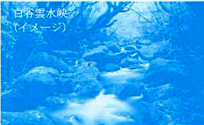
白谷雲水峡(イメージ)