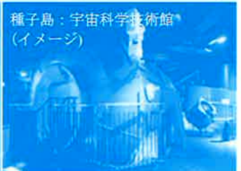
種子島：宇宙科学技術館(イメージ)