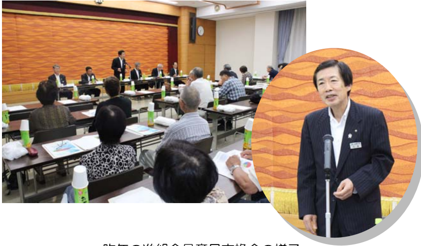
昨年の准組合員意見交換会の様子

JA西三河は、9月25日と26日の2日間、本店にて「准組合員意見交換会」を開催します。各日100人の准組合員を招き、意見交換を行います。