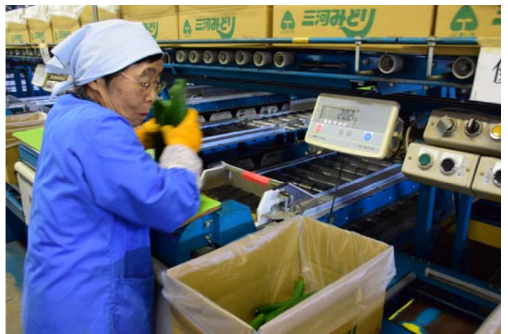
(上) 選果ラインにキュウリを並べるパート選果員 (下) 選別されたキュウリを箱に詰める