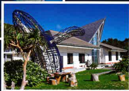
小笠原 ビジターセンター