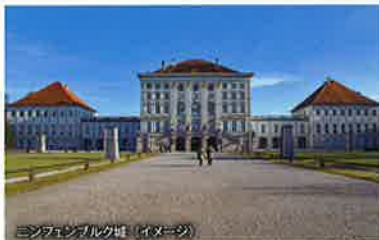
ミンデンパルク (イメージ)