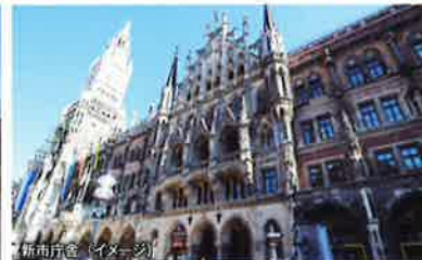
新市庁舎 (イメージ)