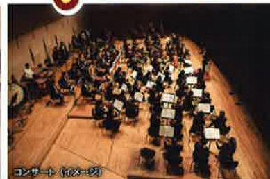
コンサート (イメージ)