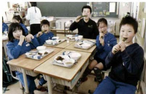
よいきゅうりの日

小中学校での野菜作り体験学習、西尾市民親子を対象とした日曜学校、県域団体と連携した米作り、JA各部会の行事（よいきゅうりの日、愛知県産小麦うどん作り等）を開催し、市民に農業体験学習の場を広く提供し、農業に対する理解促進に努めています。