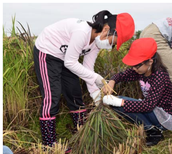
「米づくり体験授業」の様子 田植え（5月・上）・稲刈り（10月・下）

毎年度末には食農教育活動に関する意見交換会を開催しており、学校、農業指導者、JA支店の全関係者、東海農政局、愛知県、西尾市の行政機関が一堂に集まり、感想を共有し、次年度への改善、継続に向けて意識の共有を図っています。