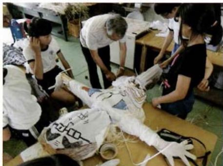
かかしづくり体験

西尾市内小学校全18校を対象に、教諭、地域農業協力者、地域住民、PTAの協力を得て米づくり体験学習を実施し、田植え、かかしづくり、稲刈り、収穫祭を行っています。田んぼアートや泥リンピック、観察記録、バケツ稲との比較等、工夫をこらし独自の取組を展開しています。収穫祭では、もちつきを主に、箱寿司、押し寿司等、郷土料理、食文化についても学ぶことができます。