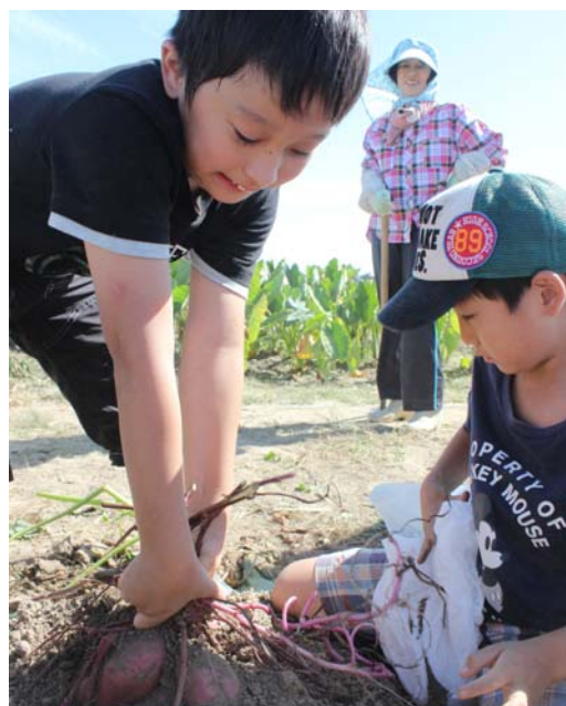
JA西三河きゅうり部会による 「良いきゅうりの日（4/19）」の キュウリ出前授業・ふれあい給食（左） JA西三河女性部による親子農園では、一年を通して 女性部員や営農職員が参加者に野菜作りを指導する（上）

農林水産省が、優れた取り組みを行う食育関係者を称え、先進事例として全国に紹介・展開して行くことを目的に開始したもの。第1回食育活動表彰の募集は平成28年11月から翌29年2月にかけて行われ、ボランティア部門3部門、教育関係者・事業者部門4部門の計7部門に、全国から合計261団体の応募がありました。