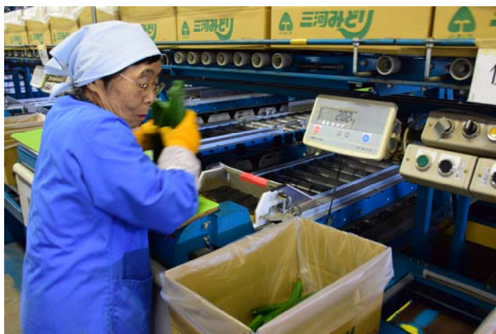
(上) 選果ラインにキュウリを並べるパート選果員 (下) 選別されたキュウリを箱に詰める