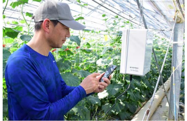
環境測定器「あぐりログBOX」（右側の白い箱）と、スマートフォンで温度・湿度などを確認する農家

データを基にした部会員同士の情報交換も盛んで、若手就農者がベテラン農家なみの収量を達成することも。高品質のキュウリを適正価格で販売することを目標に、常に新たな挑戦を続けています。