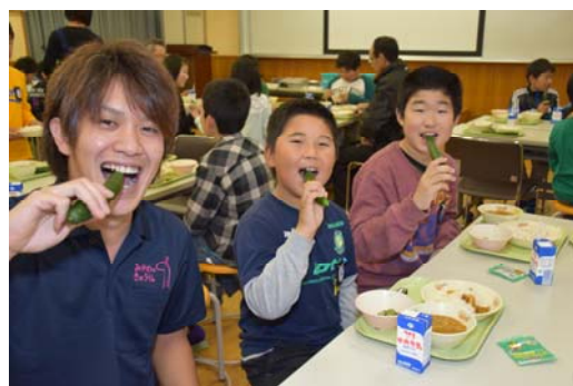
小学校での「ふれあい給食」では、キュウリの丸かじりが恒例

これ以後毎年、JA西三河・JAあいち中央のきゅうり生産者部会では、学校給食用のキュウリ寄贈や、小学校でのキュウリ出前授業、児童とのふれあい給食を行っています。近年ではこれらは恒例行事として定着し、多くの報道機関からの取材陣が学校を訪れています。