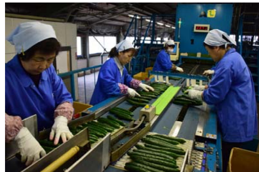
生産者が出荷されたキュウリは、JAの選果場で選別される

「三河みどり」の特徴は何と言っても「新鮮さ」。主に愛知県内の市場向けに出荷しているため、消費者のもとへ届くまでの期間が短く、他産地よりも新鮮な状態で消費者のもとへ届きます。また生産者は、部会内でのノウハウの共有や、最新のICT機器を活用した厳密な栽培環境制御などに取り組み、より高品質なキュウリ生産につなげようと日々努力しています。