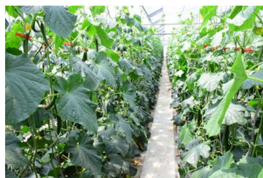
キュウリの栽培施設 真冬でも高温多湿の状態に保たれている