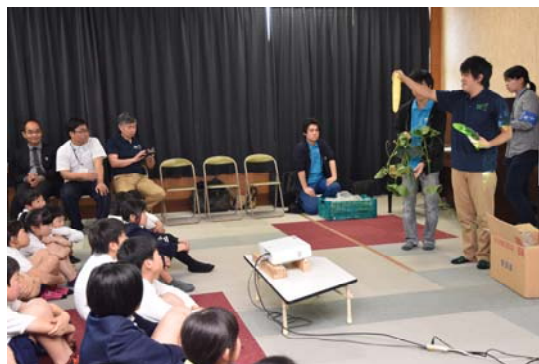
キュウリ授業で若手生産者が児童に向けて説明