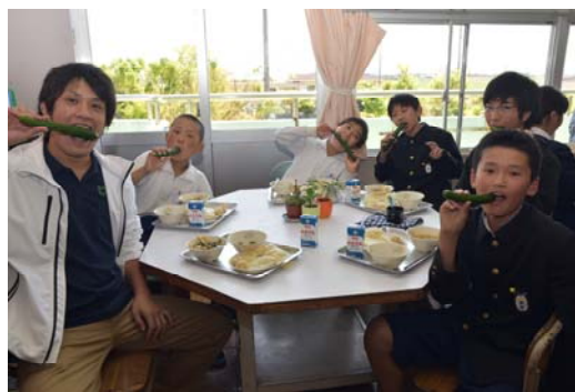
ふれあい給食ではキュウリの丸かじりが恒例