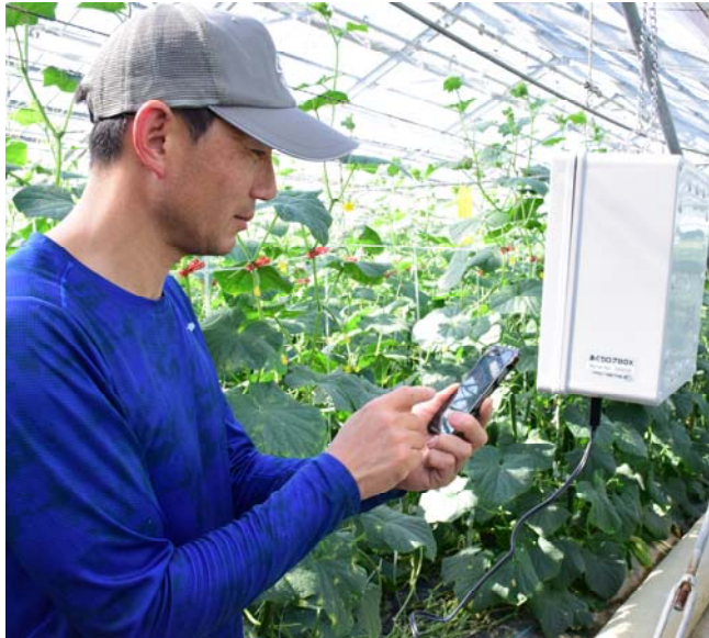
環境測定器「あぐりログBOX」(白い箱)と、スマートフォンで温度・湿度などを確認します