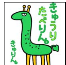
西三河冬春きゅうり部会のキャラクター「きゅうりん。」

https://www.maff.go.jp/j/tokei/kouhyou/sakumotu/sakkyou_yasai/