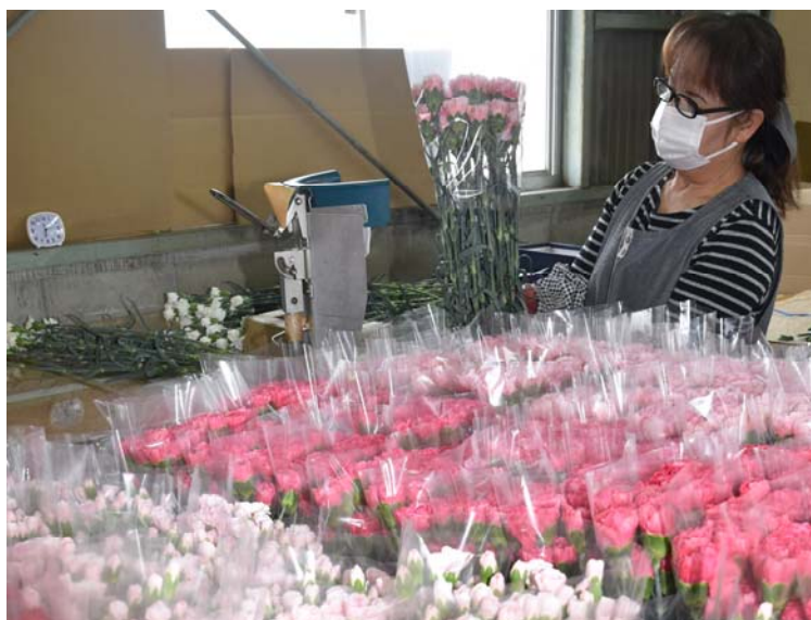
JA選花場での出荷作業のようす (このように場面を整えることもできます)